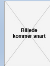
Kandidat fra Egnsnettet