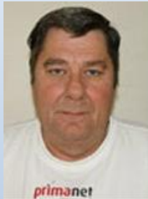
Keld Skaarup Ørsted Accept Genvalg