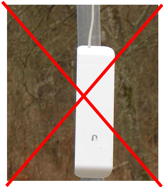
Ikke korrekt montering